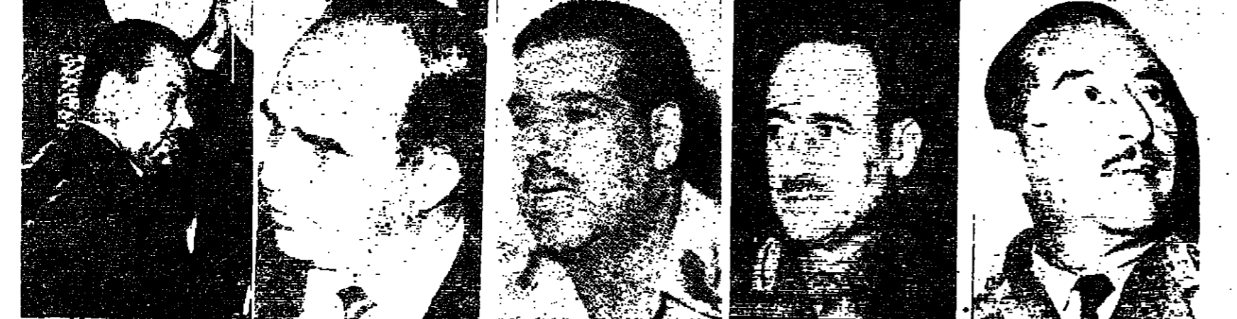
احمد حسن البكر - عبد الرحمن عارف - جردان الكردي - عبد العزيز العقيلي - طاهر يحيى

بيروت - اقلية - انتخب مجلس قيادة الثورة الجديد في العراق بالاجماع اللواء احمد حسن البكر رئيسا للجمهورية - كما عين اللواء الطيار جردان الكردي رئيسا لركان الجيش العراقي - وقد جاءت هذه التعيينات في اعقاب انقلاب عسكري وقع في العراق صباح امس اطاح بالفريق عبد الرحمن عارف وقال القاتمون به انه لاعادة الخط التقدمي الاشتراكي الواضح لثورة ١٤ تموز ١٩٥٨.